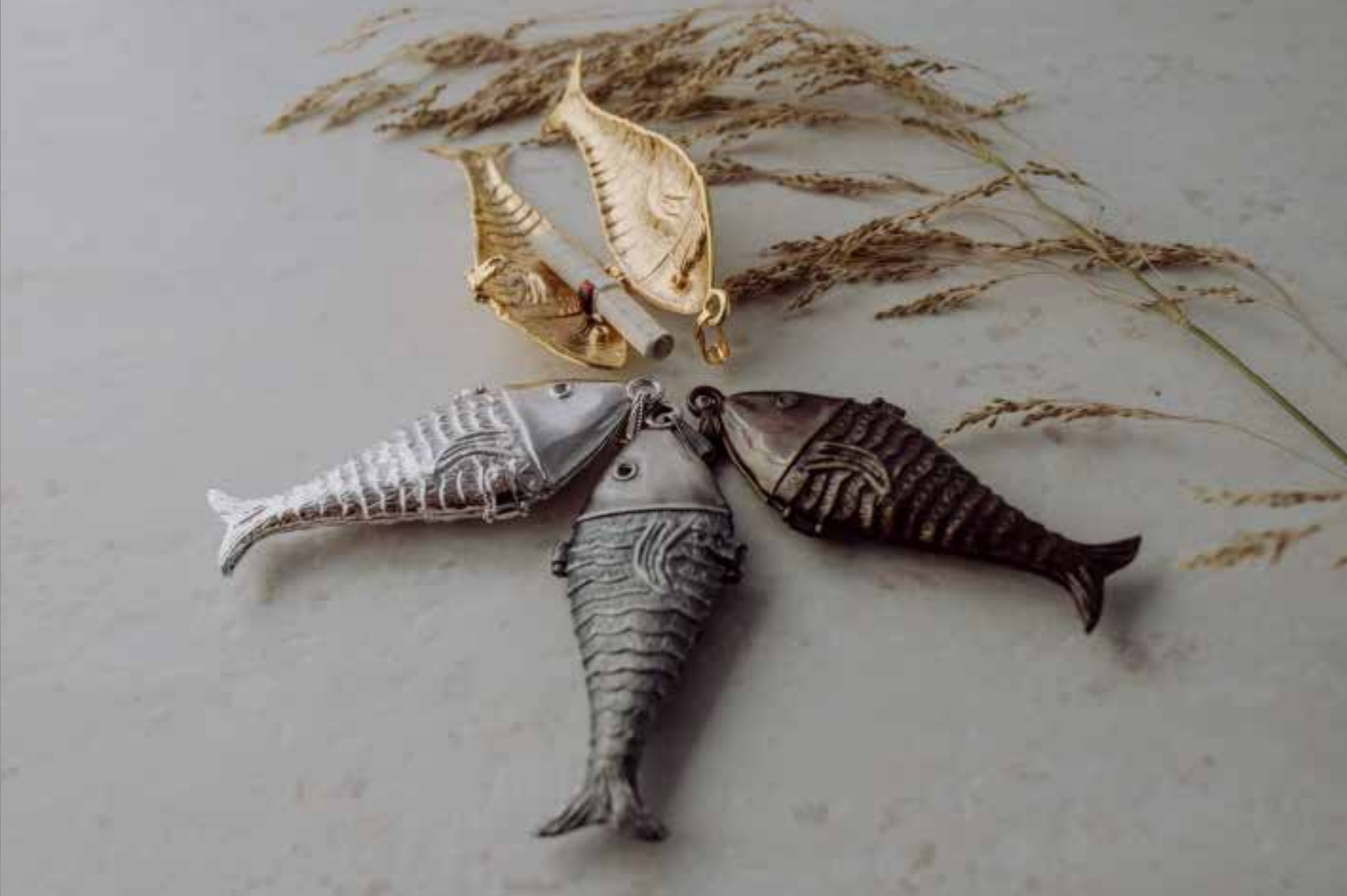
884 Peix Metal 3 x 7 cm (Con cadena y evangelio lacrado en el interior)