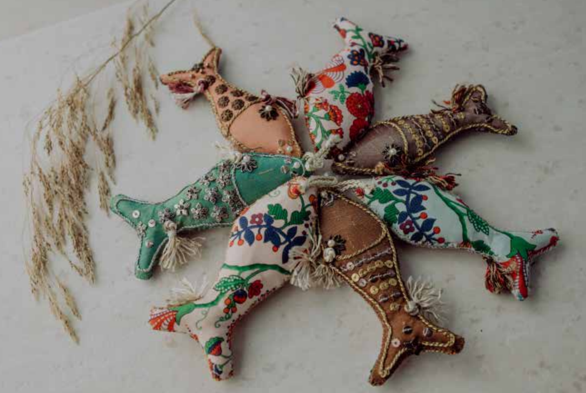
882 Peix Brodado 4 x 9 cm