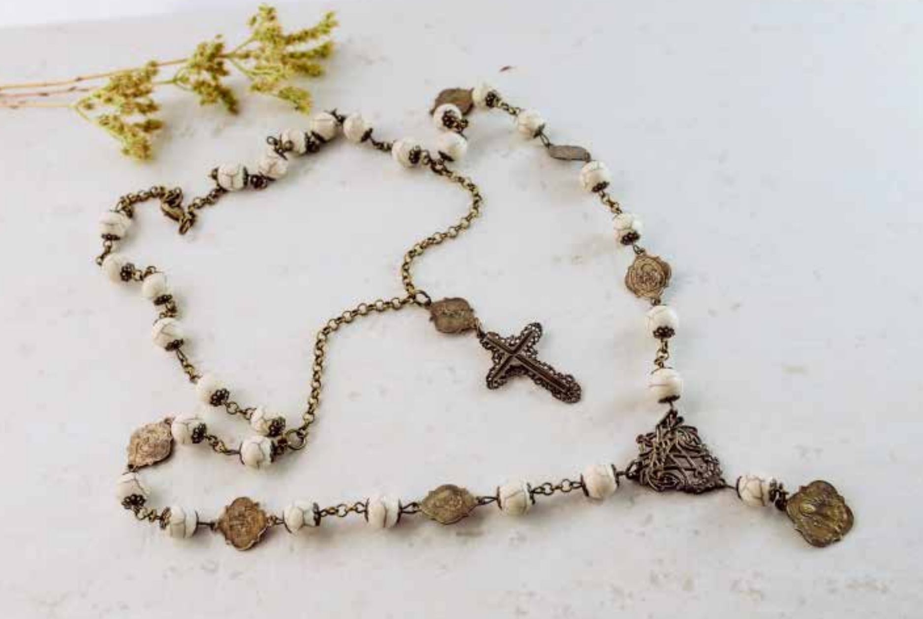
1023 Collar Cuentas de los 7 Dolores Ø 10 mm (Disponible también en nacar con Ø 8 mm Ref. 1024)