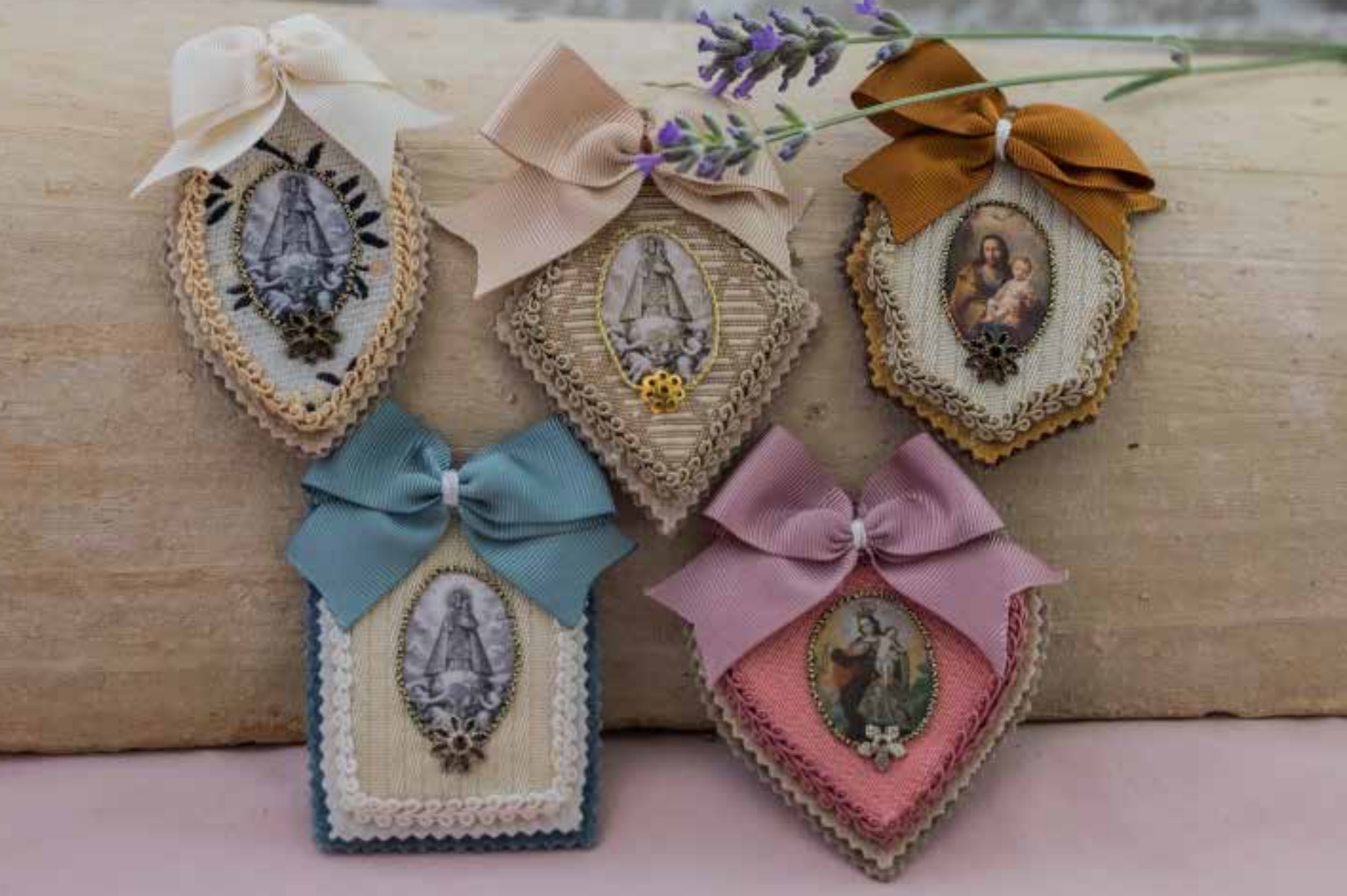
502 Broche Mediano 4 x 6 cm