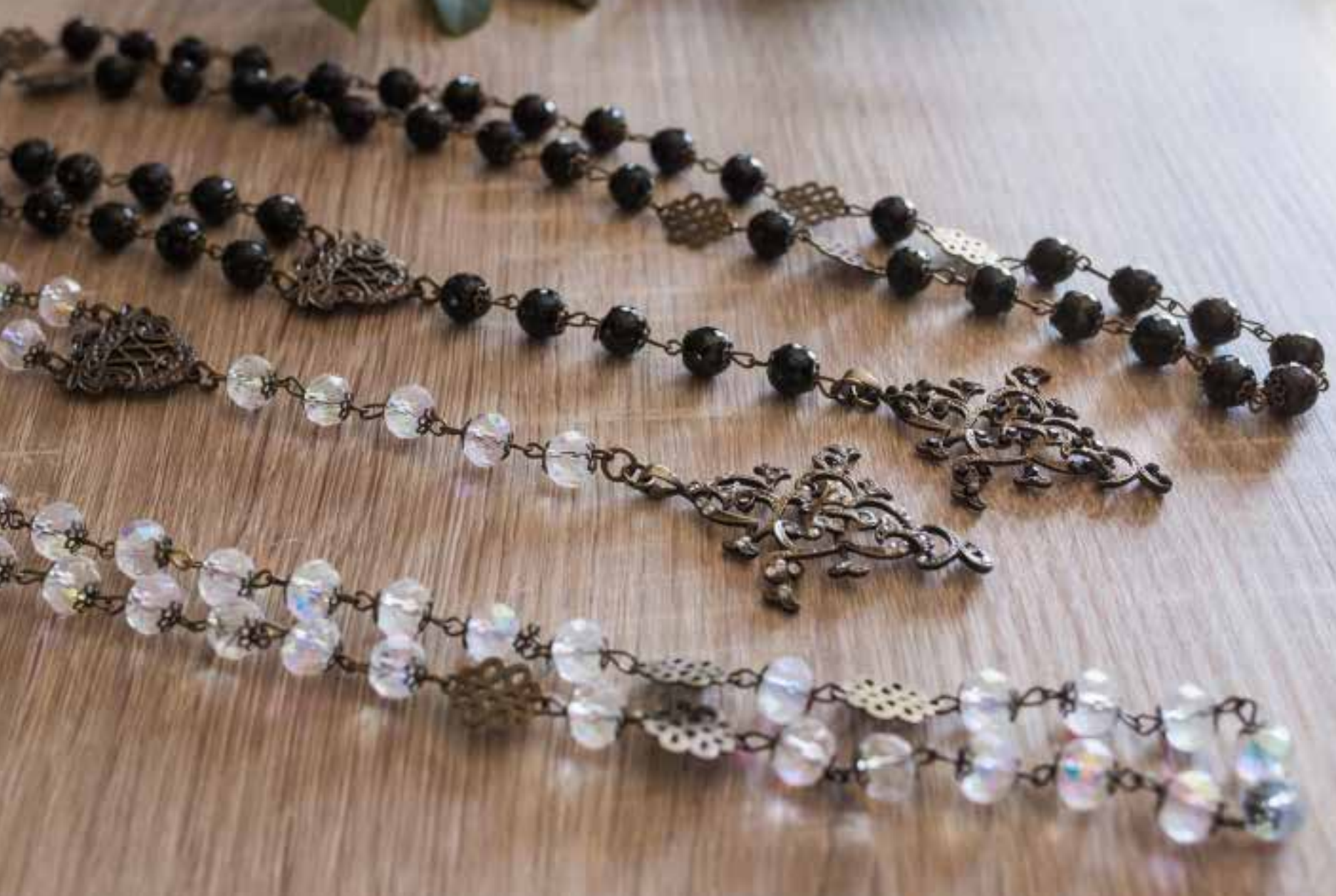
1022 Rosario Santet Ø 10 mm con Cruz Ramas Piedra